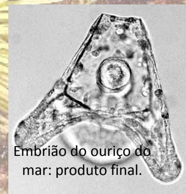
Embrião do ouriço do mar: produto final.