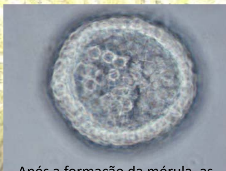
Após a formação da mórula, as células dirige-se para um invólucro de fecundação.